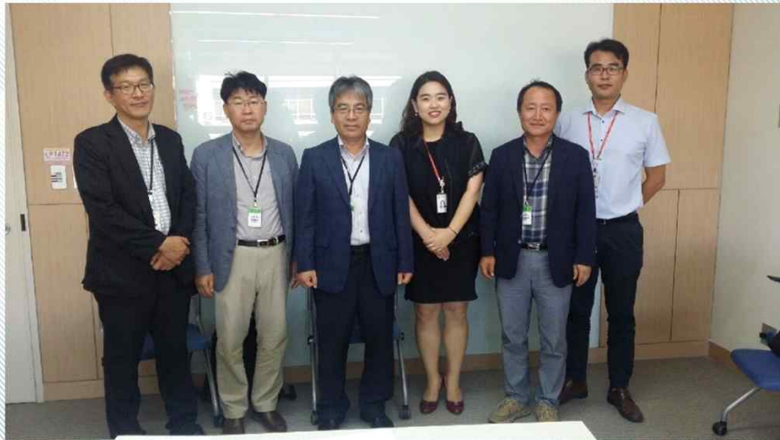
국교련 대학재정특위-인사혁신처-교육부 실무 협의 당시 (2017.08.31.(목), 세종청사 산자부 소회의실)