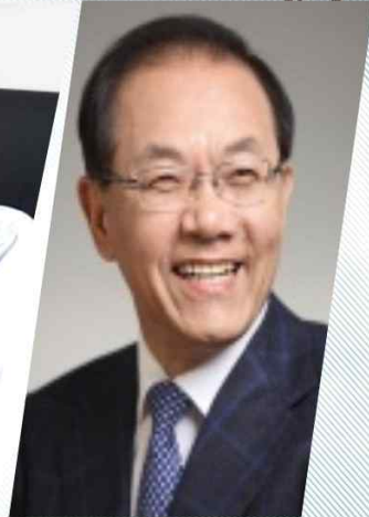
황우여 제56대 교육부 장관 2014.08.08.~2016.01.12