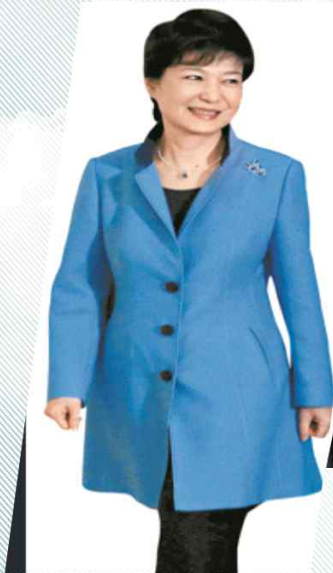
제18대 대통령 박근혜 2013.02.25.~2017.03.10.